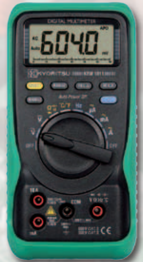
KEW 1011 平均値タイプ 温度測定機能(温度プローブ付属) 標準価格 9,000円(消費税別)