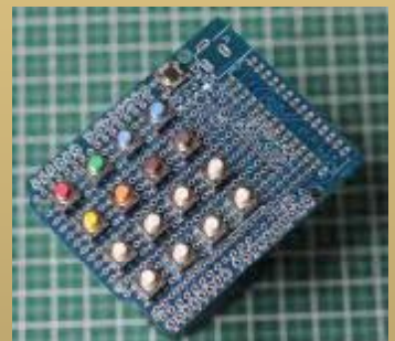
製作例 シールドとしても使えます

Arduinoの手軽さをそのままに、部品を載せるスペースを最大限に確保しました。 基板単体、ブートローダー書き込み済みIC付属組み立てキット 2種類 販売中