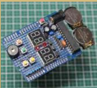
製作例 基板1枚で時限タイマー